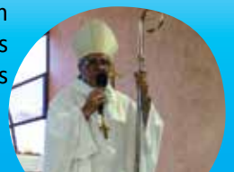
Dom Ângelo Pignoli Bispo Diocesano de Quixadá-CE

O gesto de Maria, que “oferece”, se traduz em gesto litúrgico em cada Eucaristia. Quando o pão e o vinho, frutos da terra e trabalho humano, vos são retidos como corpo e sangue de Cristo, nós também estamos na paz do Senhor, pois contemplamos sua salvação e vivemos à espera de sua “vinda”.